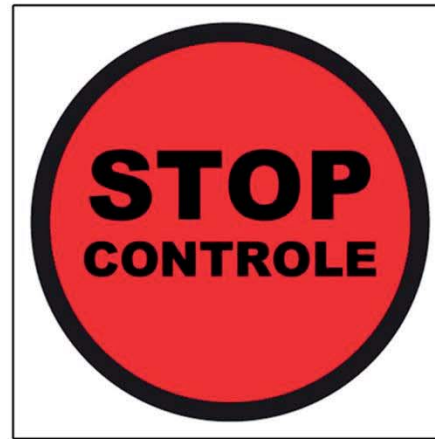
STOP BEMANDE CONTROLE