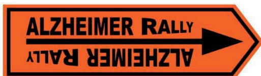
ROUTERICHTING OF OMLEIDING