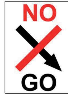
WEG MAG NIET BEREDEN WORDEN