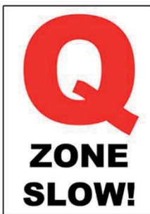
QUIET-ZONE MAX. 30 KM/U